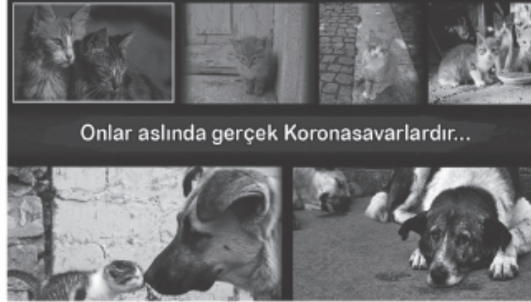
Onlar aslında gerçek Koronasavarlardır...

"Evcil hayvanlar, özellikle köpekler ve kediler, stres, anksiyete ve depresyon seviyesini düşürebilir, yalnızlıkla baş etmeyi kolaylaştırabilir, egzersiz yapmaya ve oyun oynamaya teşvik edebilir; hatta kardiyovasküler sisteminizi daha sağlıklı hale bile ge-