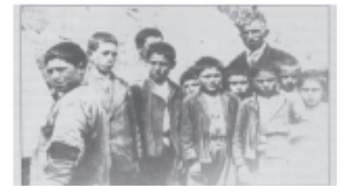
Yoksul köy çocukları.

51... Her ne kadar kendi düşüncesi olarak yazmamış görünse de, kendisinin de böyle düşündüğü belli. Toplumda "yarı aydın" bile olsa okuyazar sayısının artması, bunlar içinden en iyilerin seçilmesi, böylece "üst düzey" aydın ya da bilimci havuzunun genişlemesi kötü bir şey mi? Ayrıca, Cumhuriyet'in yükseköğretimi geliştirme çabalarını yok mu sayalım?