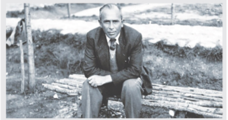
Enstitüelilerin "Tonguç Baba"sı.

Bu yıl 17 Nisan Köy Enstitüleri'nin 60. kuruluş yıl dönümünü. İlerici bir atımda Köy Enstitüleri. Hatta Cumhuriyet'in eğitimde yaptığı bir devrimdi, diyebiliriz. Maalesef ömrü kısa oldu. Ömrünün kısa olmasının nedeni,