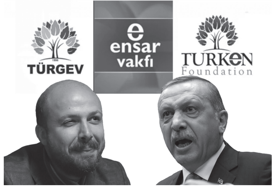
AKP’giller, memleketi soymaya “Vakıflar” aracılığıyla tam gaz devam ediyor...

“Nihayet, belki bir bakıma Padişah da haklı... Ve şimdikinden daha mantıksal sosyal bir geleneğe uymaktadır. Çünkü vaktiyle hasırı bulunmayanların (‘İşte bütün servetim bu yüzük. İstanbul’a hizmete hazırım’ diyenlerin – M. Şahbaz.), Devlet hizmetleriyle geçen hayatlarından sonra ölürken milyonlar (küpledikleri 300 milyar dolarları– M. Şahbaz.) bırakmaları, elbet alın teriyle yapılmış bir kazancı gösteremez. Osmanlı rejimi, haklı (Mirî Toprağın niteliği ve sosyal adalet bakımından haklı) olarak, kişisel servet birikişleri karşısında gayet kaygısız bir müsaderecidir. Ölen, hiçbir faninin tek başına ve kendi emeğiyle kazanamayacağı zenginliğe sahiptir. Bu zenginlik, Devlet ve rejim imkânları zorlanarak başkalarını soymakla elde edilmemiş midir? O baskalarından toplanmış